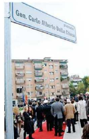
Il Memory day in città